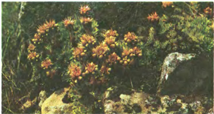
962. Молодило руське.